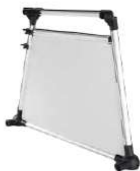
parete laterale destra