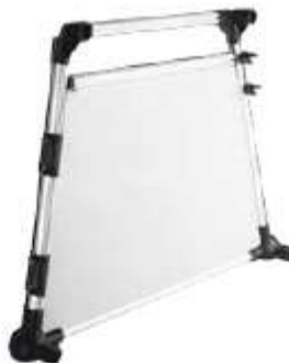
parete laterale sinistra